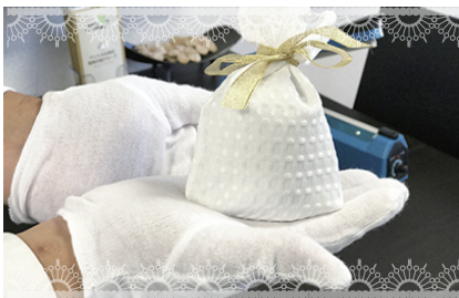
⑦専用の巾着袋に入れさせて頂きリボンで結びます。