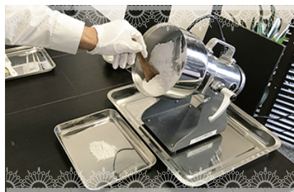
⑤ご収骨させて頂きます。