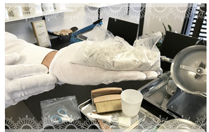
⑥パウダー状のご遺骨がこぼれない様に袋口を熱圧着いたします。