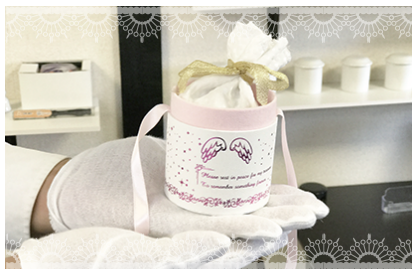
⑧専用のケースにお入れいしご自宅にご郵送でお届けいたします。