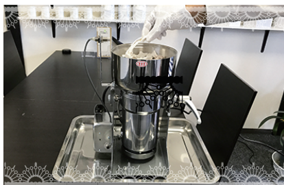
①お預かりしたご遺骨を丁寧に粉骨機に移動させて頂きます。