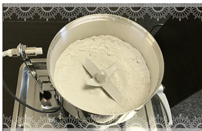
④ご遺骨がパウダー状に加工されているか目視で確認いたします。