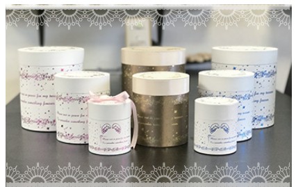
↑専用のケースは、ピンク・ブルー・ブラウンの3色から選べます。